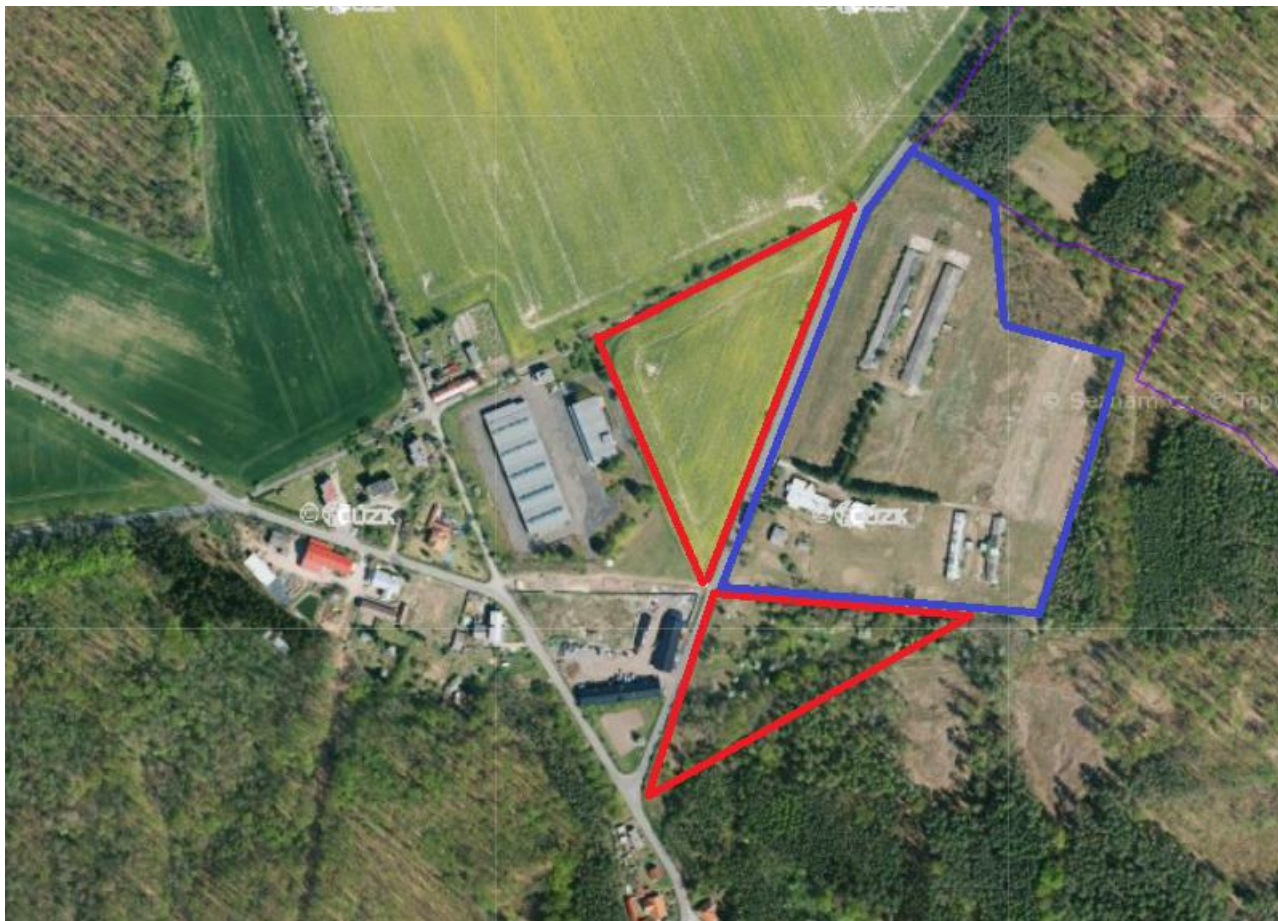
Schéma lokality Mcely-Háje – červenou linií zvýrazněny plochy pro plánovanou výstavbu rodinných a obytných domů na parcelách č. 919/5 a 189; modrou linií plochy přestavby zemědělského areálu řešené regulačním plánem „Mcely Z1-4“